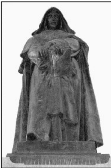
Bronzová socha Giordana Bruna, ktorá stojí na Campo de Fiori v centre Ríma. Socha sa nachádza na mieste, kde tohto talianskeho filozofa v roku 1600 upálila inkvizícia za odpadlivosť od rímskokatolíckej viery.

ky, považovanej za skvost predrenesančného obdobia, zabrali cca 120 000 hodín ľudskej práce a stáli 40 mil. USD. Bazilika bola znovuvysvätená slávnostne 28. novembra minulého roka.