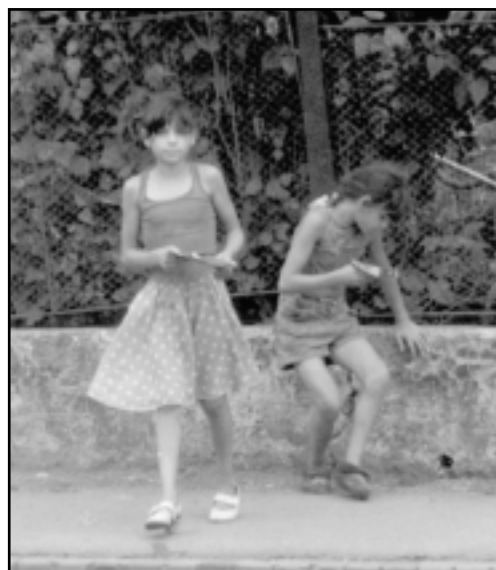
Žobrajúce rómske deti

Po rozpade Sovietskeho zväzu v roku 1990 obchody na Ukrajine úplne zmenili svoju tvár. Dnes je väčšina z nich preplnená domácimi a zahraničnými výrobkami. Bohatý výber doplní ponuka tržnic, kto-