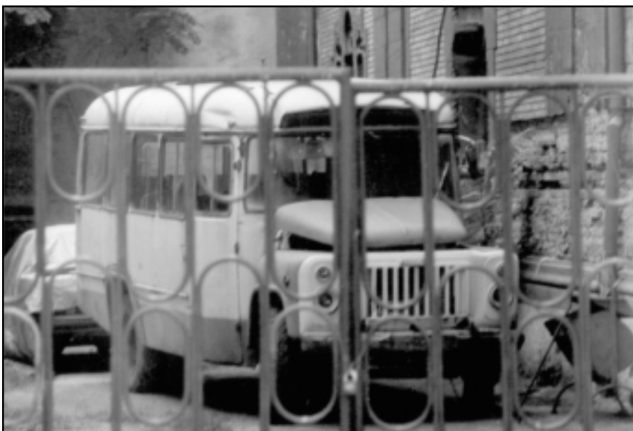
Na ulici občas stretnete aj takéto autobusy

Pre niektorých ľudí sa Ukrajina stotožňuje s tromi pojmami: Černobyľ, Dynamo Kyjev a alkoholizmus. Ak si však niekto myslí, že sú to všetky zaujímavosti, ktoré im môže táto krajina ponúknuť, tak sa mylí. Ukrajina má bohatú históriu, ktorá tisíce rokov zanecháva svoje stopy na múroch starobylých hradov a v uliciach miest; odráža sa aj na širokých slovenských tvárach jej obyvateľov, v ktorých často badať aj hlboké východné črty. Obyvateľstvo Ukrajiny tvo-